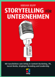
Storytelling für Unternehmen