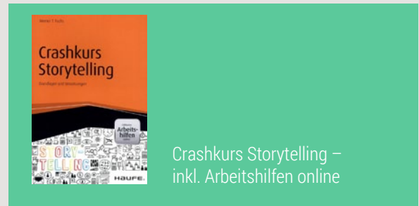
Crashkurs Storytelling – inkl. Arbeitshilfen online